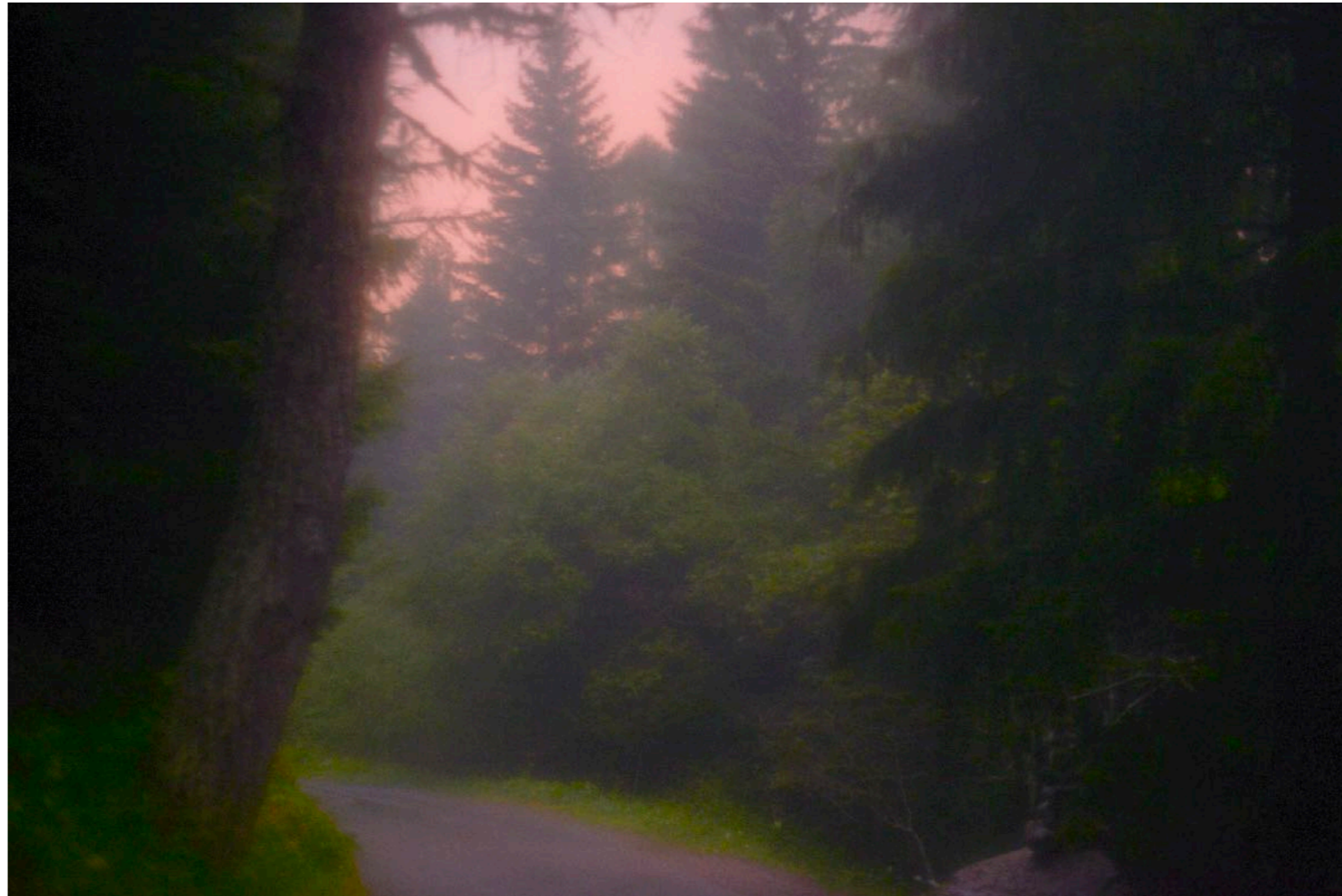
Sans titre , série Froisser la nuit , dimensions variables, Hahnemühle Papier Photo Rag Baryta 315g, finition sur dibond. 2024. Editions de 05 tirages + 01 d'artiste.