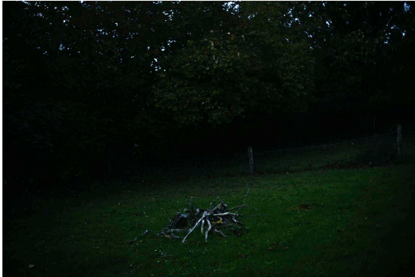
Sans titre , série D'autres matins , dimensions variables, Hahnemühle Papier Photo Rag Baryta 315g, finition sur dibond. 2024. Editions de 05 tirages + 01 d'artiste.