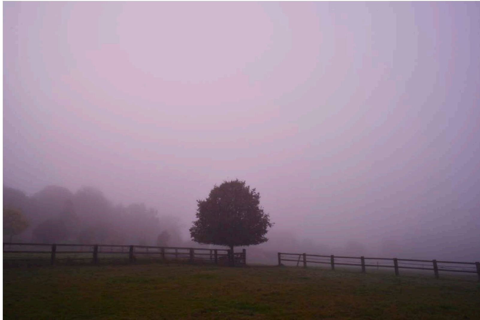
Sans titre , série D'autres matins , dimensions variables, Hahnemühle Papier Photo Rag Baryta 315g, finition sur dibond. 2024. Editions de 05 tirages + 01 d'artiste.