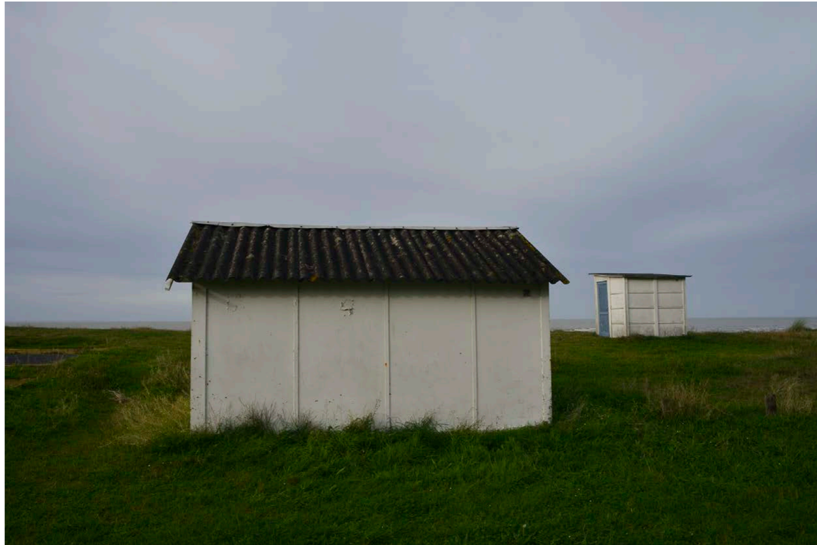
Sans titre , série D'autres matins , dimensions variables, Hahnemühle Papier Photo Rag Baryta 315g, finition sur dibond. 2024. Editions de 05 tirages + 01 d'artiste.