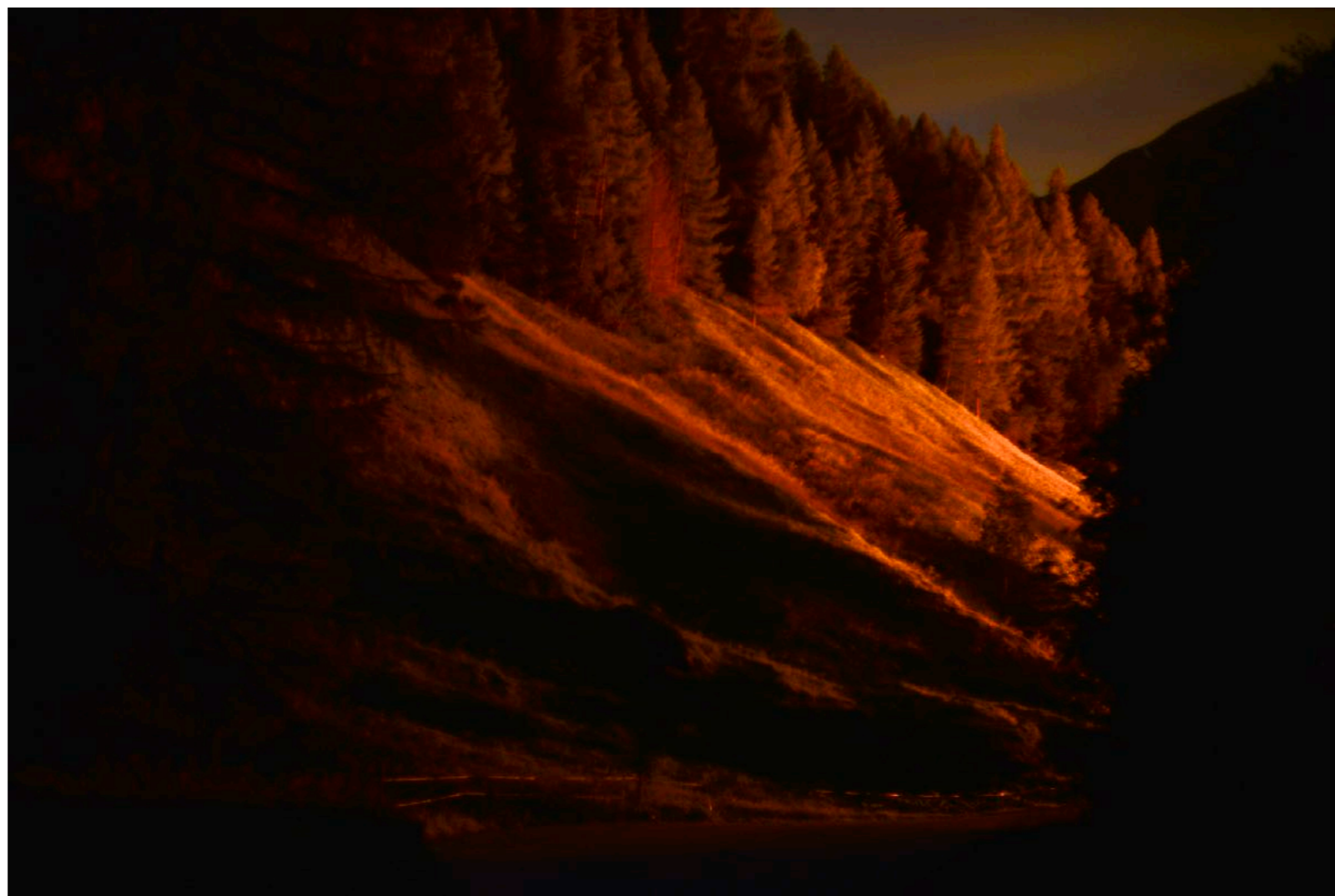
Sans titre , série Froisser la nuit , dimensions variables, Hahnemühle Papier Photo Rag Baryta 315g, finition sur dibond. 2024. Editions de 05 tirages + 01 d'artiste.