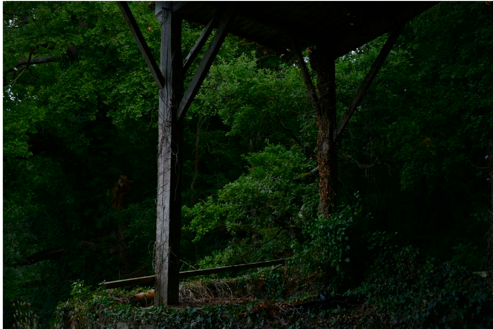
Sans titre , série Interstice(s) , dimensions variables, Hahnemühle Papier Photo Rag Baryta 315g, finition sur dibond. 2024. Editions de 05 tirages + 01 d'artiste.