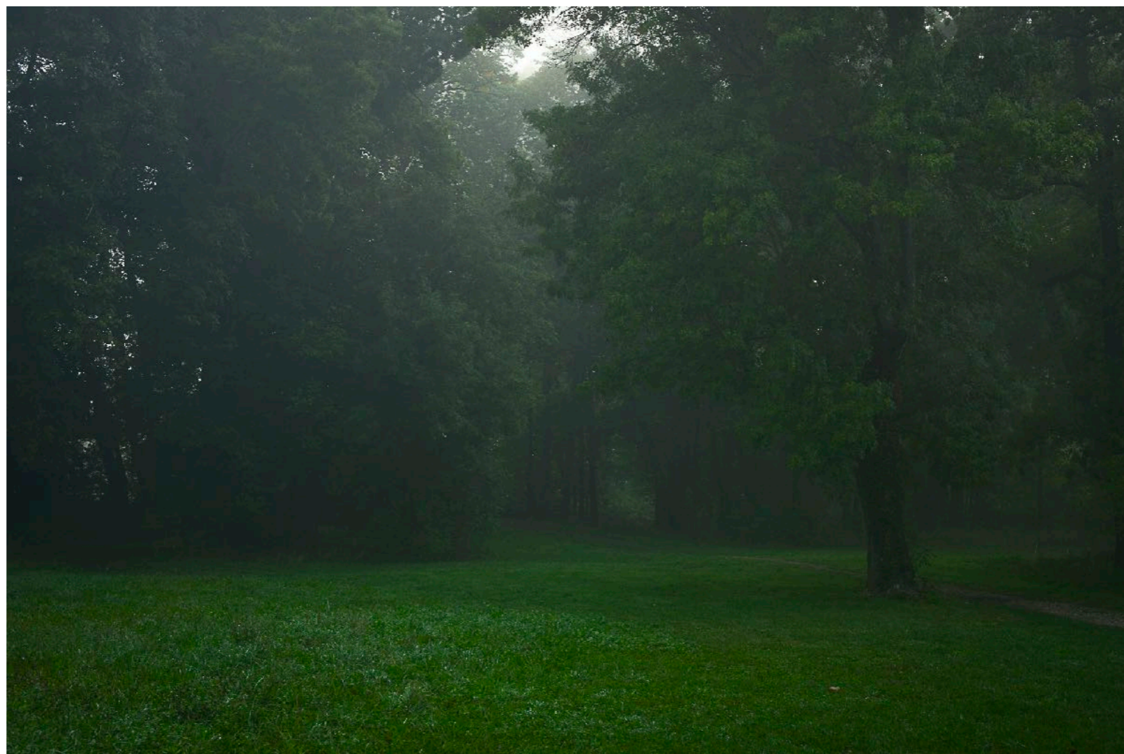
Sans titre , série Interstice(s) , dimensions variables, Hahnemühle Papier Photo Rag Baryta 315g, finition sur dibond. 2024. Editions de 05 tirages + 01 d'artiste.