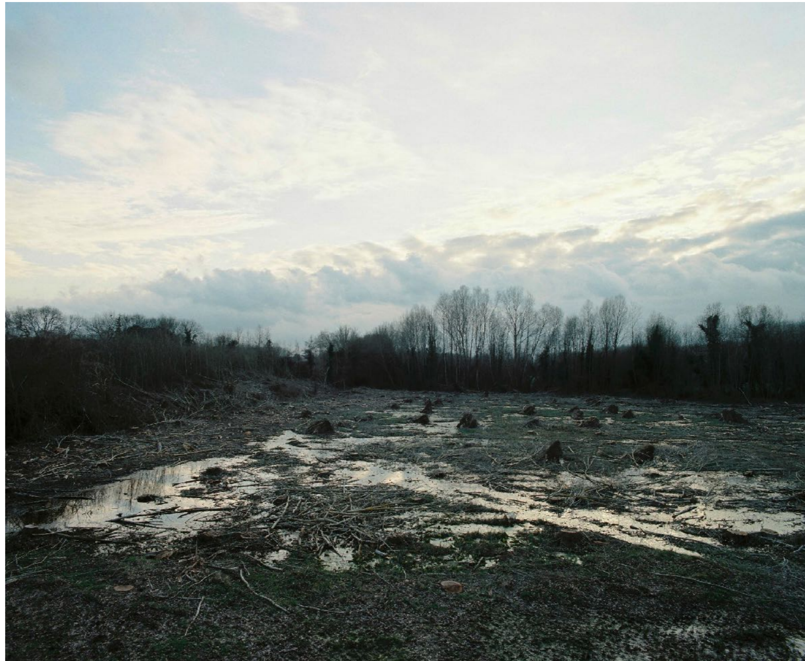
Sans titre, série D'Ombres et de pierre, dimensions variables, Hahnemühle Papier Photo Rag Baryta 315g, finition sur dibond. 2024. Editions de 05 tirages + 01 d'artiste.