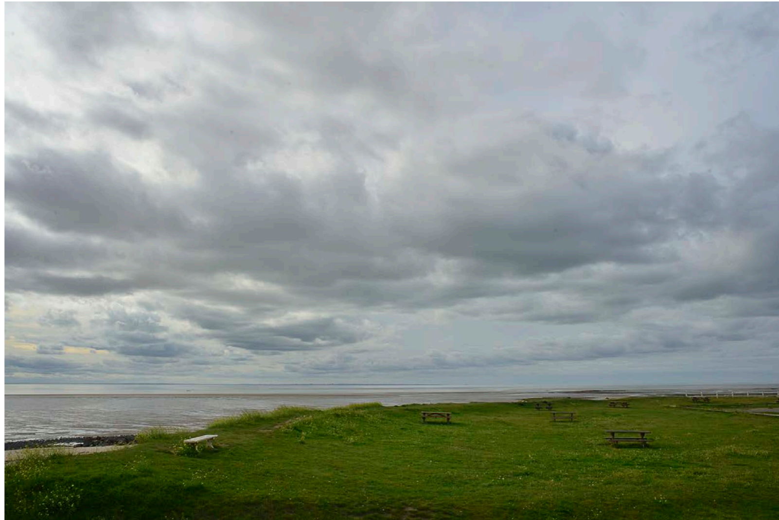
Sans titre , série Interstice(s) , dimensions variables, Hahnemühle Papier Photo Rag Baryta 315g, finition sur dibond. 2024. Editions de 05 tirages + 01 d'artiste.