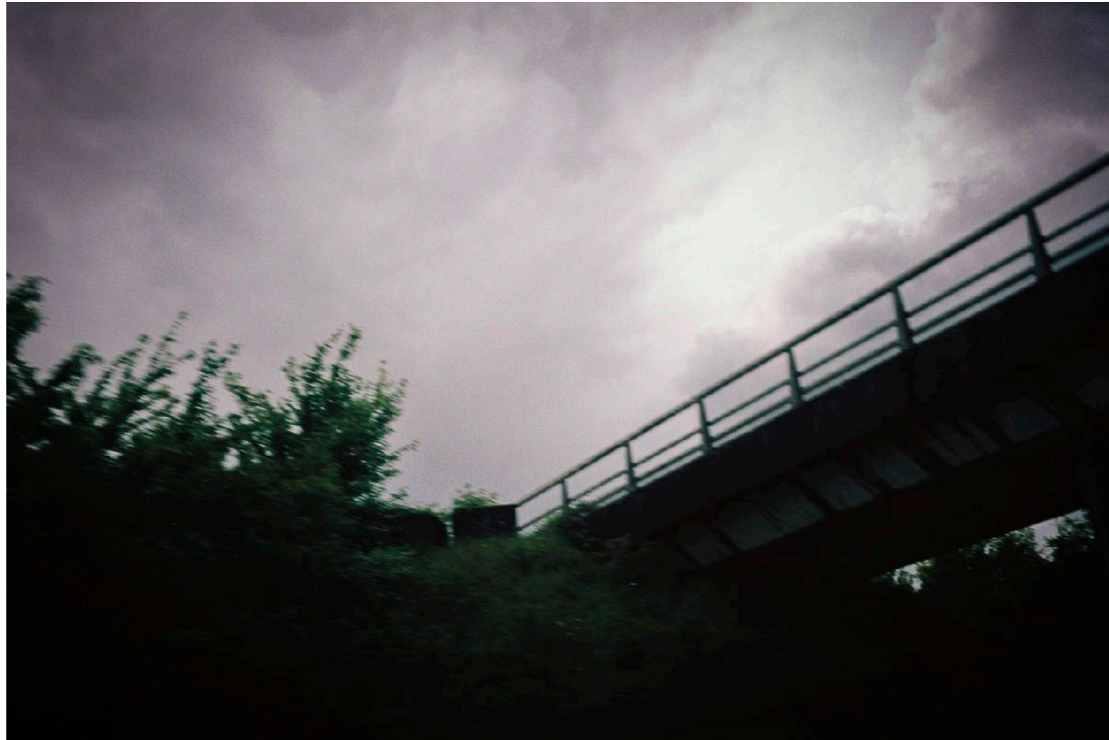
Sans titre , série Des soleils maladroits , dimensions variables, Hahnemühle Papier Photo Rag Baryta 315g, finition sur dibond. 2024. Editions de 05 tirages + 01 d'artiste.