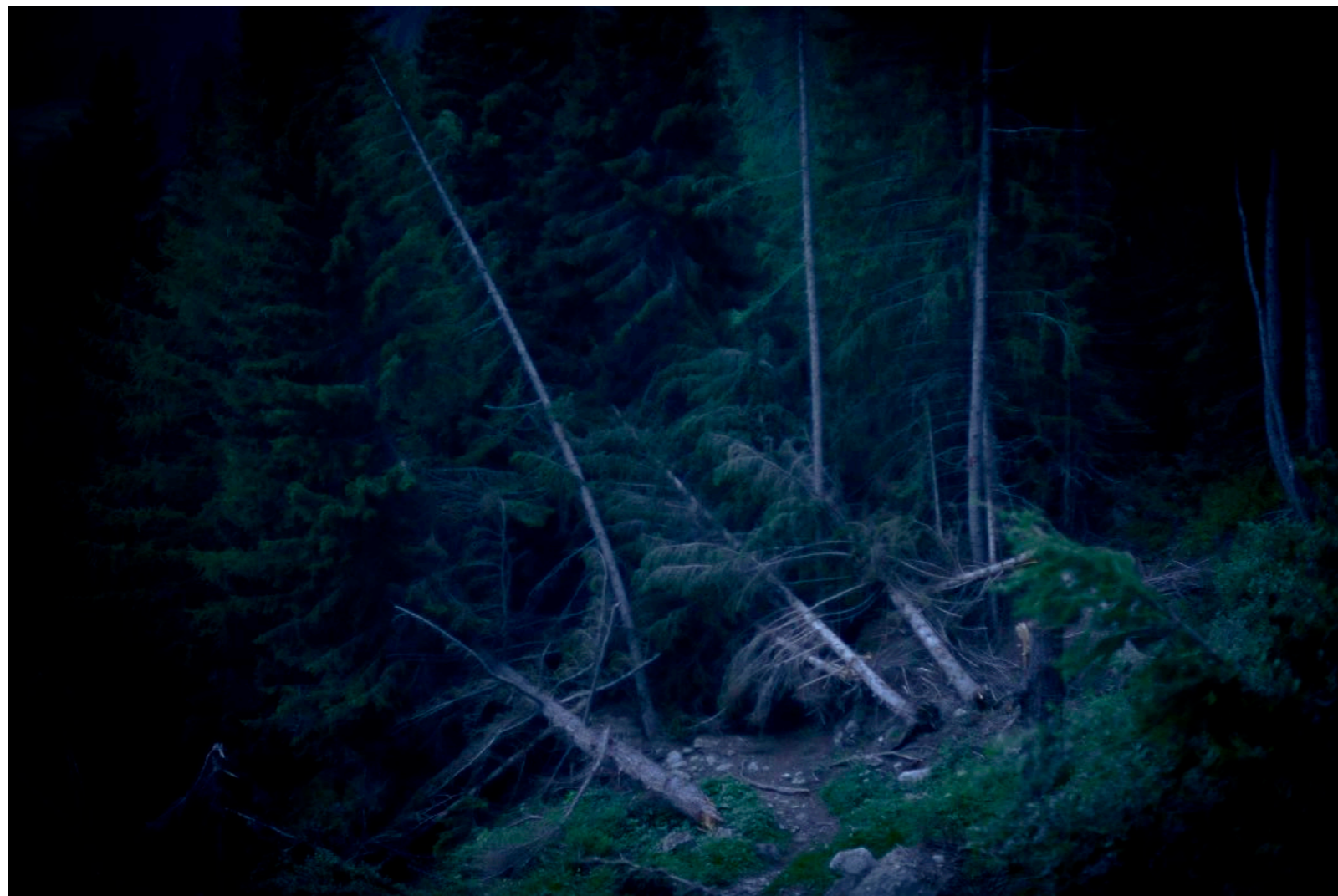
Sans titre , série Froisser la nuit , dimensions variables, Hahnemühle Papier Photo Rag Baryta 315g, finition sur dibond. 2024. Editions de 05 tirages + 01 d'artiste.