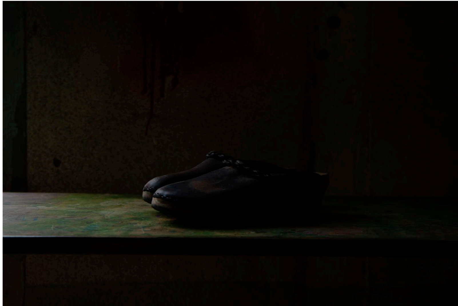
Sans titre , série Vestiges , dimensions variables, Hahnemühle Papier Photo Rag Baryta 315g, finition sur dibond. 2024. Editions de 05 tirages + 01 d'artiste.