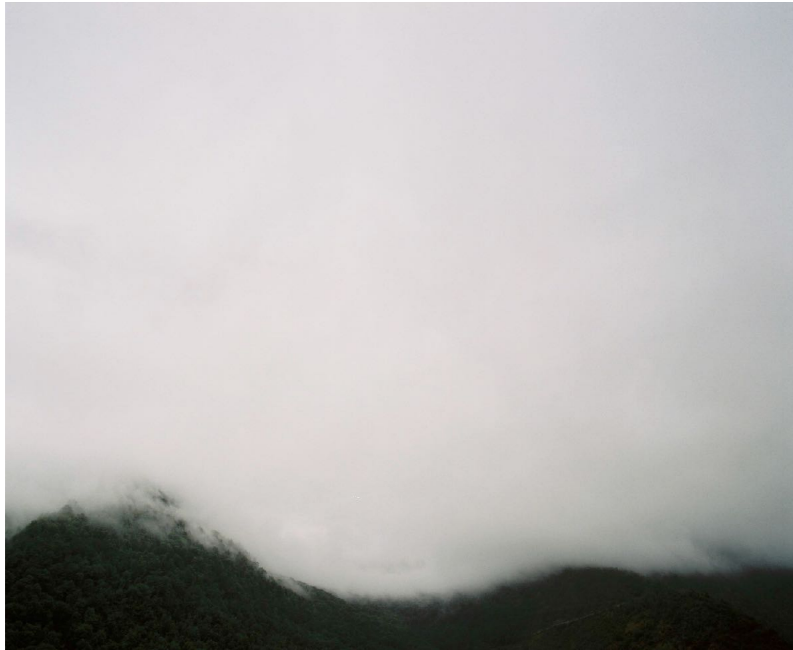
Sans titre , série D'Ombres et de pierre , dimensions variables, Hahnemühle Papier Photo Rag Baryta 315g, finition sur dibond. 2024. Editions de 05 tirages + 01 d'artiste.