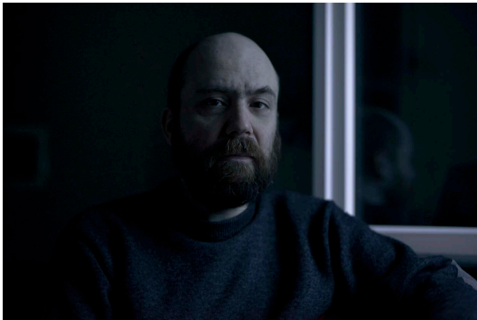
Sans titre, série D'autres matins, dimensions variables, Hahnemühle Papier Photo Rag Baryta 315g, finition sur dibond. 2024. Editions de 05 tirages + 01 d'artiste.