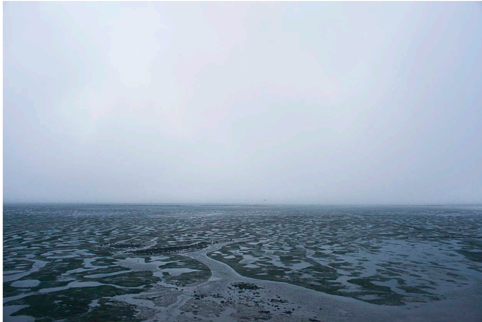
Sans titre , série Interstice(s) , dimensions variables, Hahnemühle Papier Photo Rag Baryta 315g, finition sur dibond. 2024. Editions de 05 tirages + 01 d'artiste.