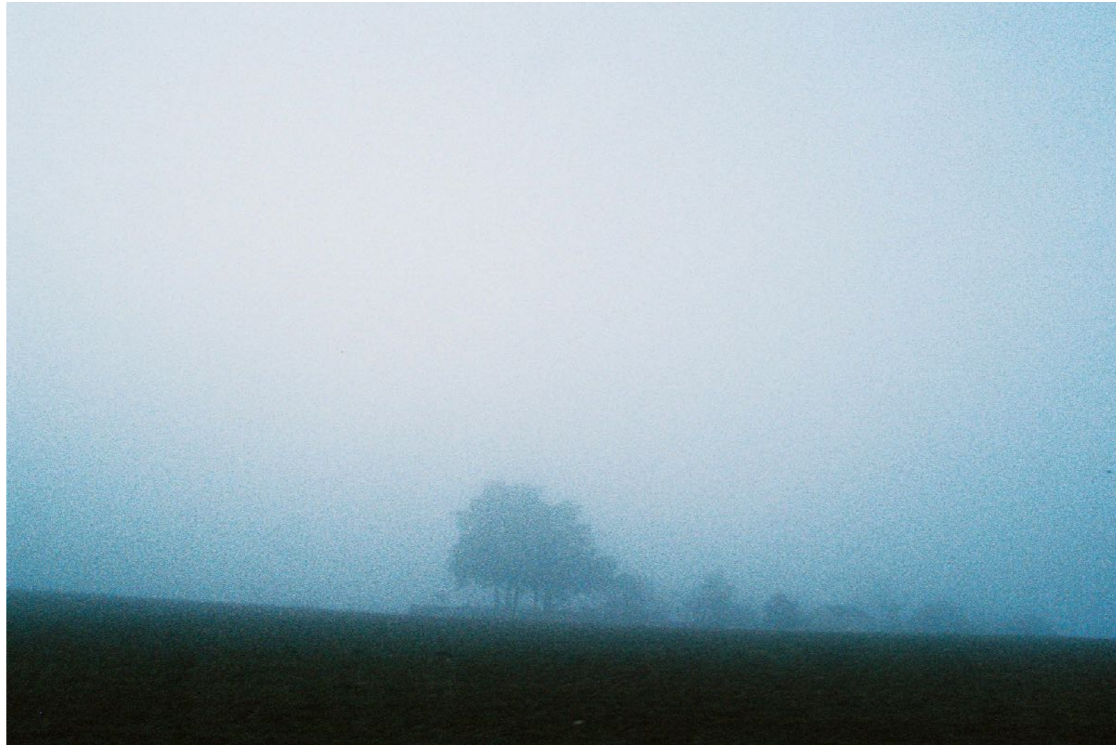
Sans titre , série Des soleils maladroits , dimensions variables, Hahnemühle Papier Photo Rag Baryta 315g, finition sur dibond. 2024. Editions de 05 tirages + 01 d'artiste.