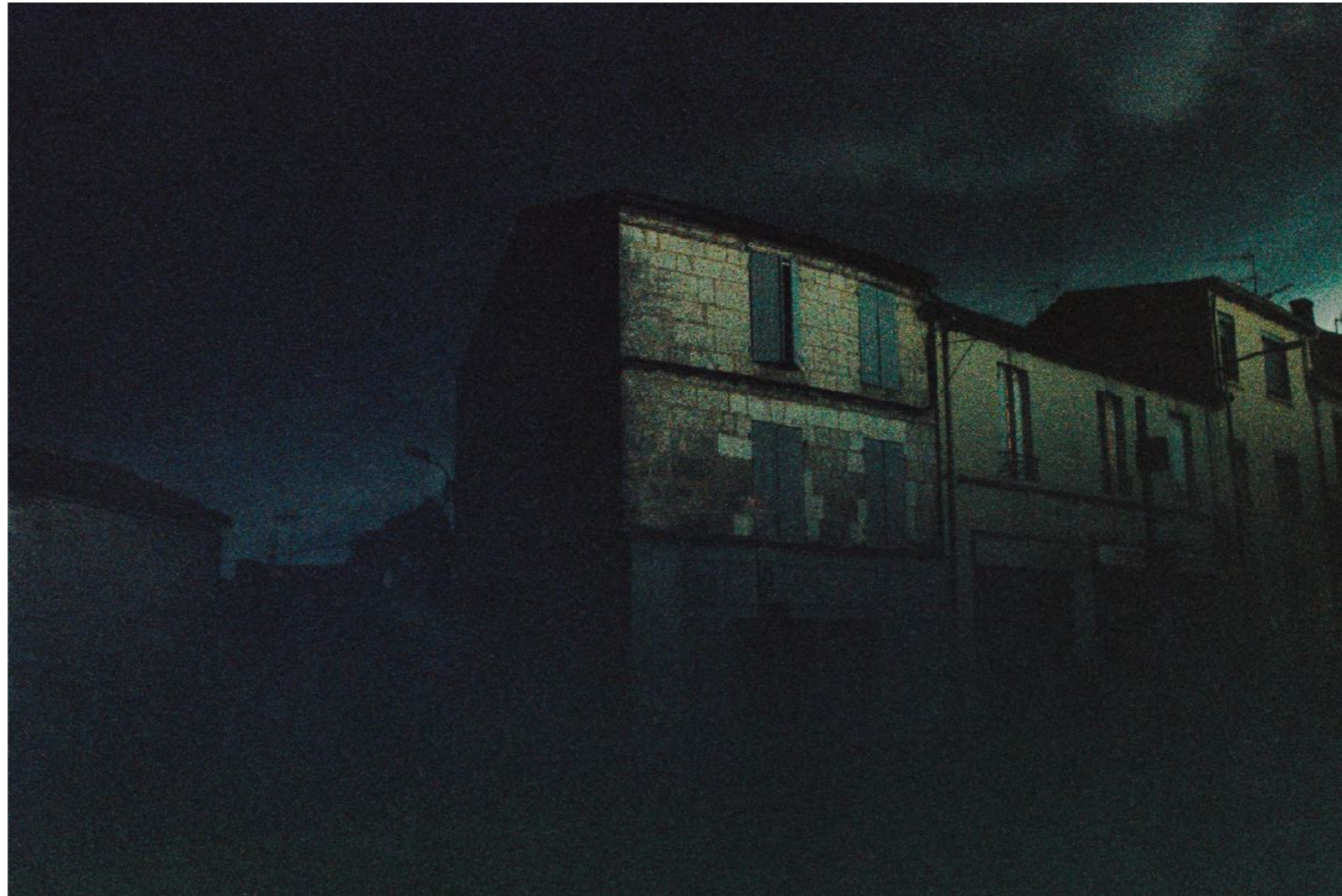
Sans titre, série Des soleils maladroits, dimensions variables, Hahnemühle Papier Photo Rag Baryta 315g, finition sur dibond. 2024. Editions de 05 tirages + 01 d'artiste.