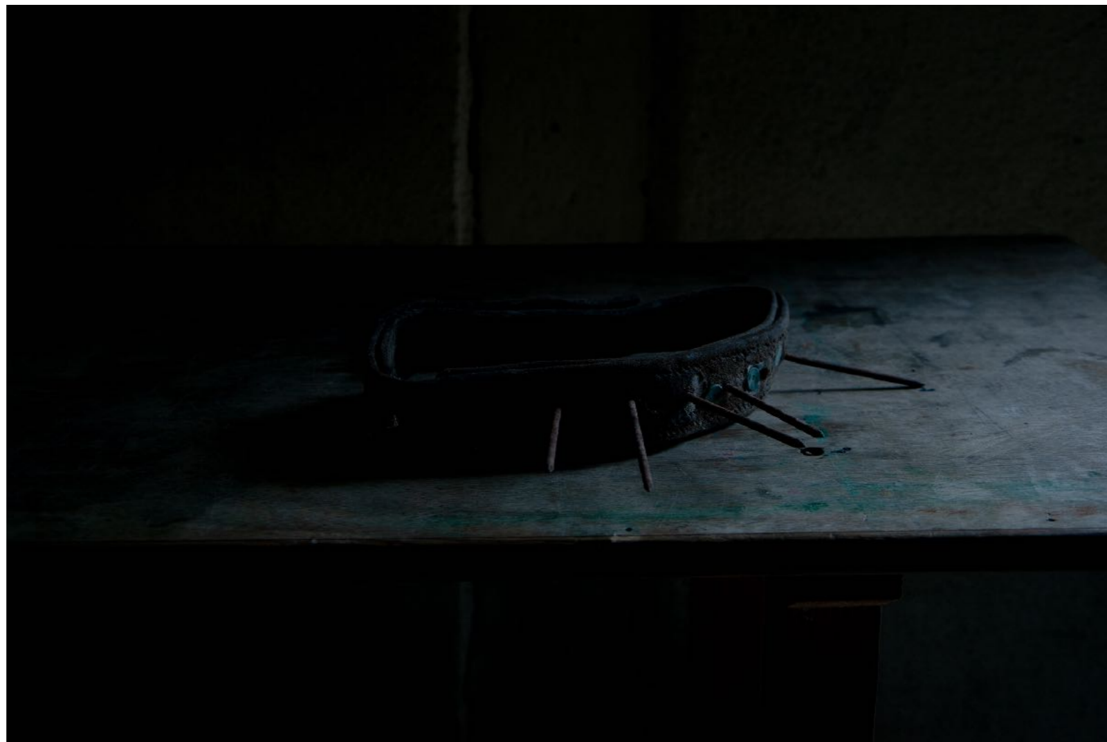
Sans titre , série Vestiges , dimensions variables, Hahnemühle Papier Photo Rag Baryta 315g, finition sur dibond. 2024. Editions de 05 tirages + 01 d'artiste.