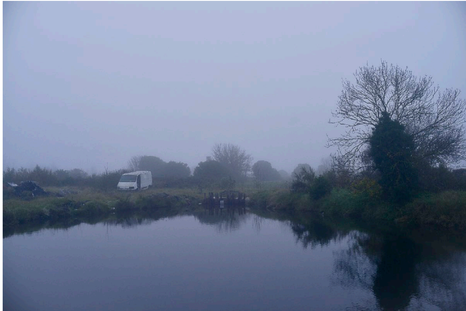
Sans titre , série Interstice(s) , dimensions variables, Hahnemühle Papier Photo Rag Baryta 315g, finition sur dibond. 2024. Editions de 05 tirages + 01 d'artiste.