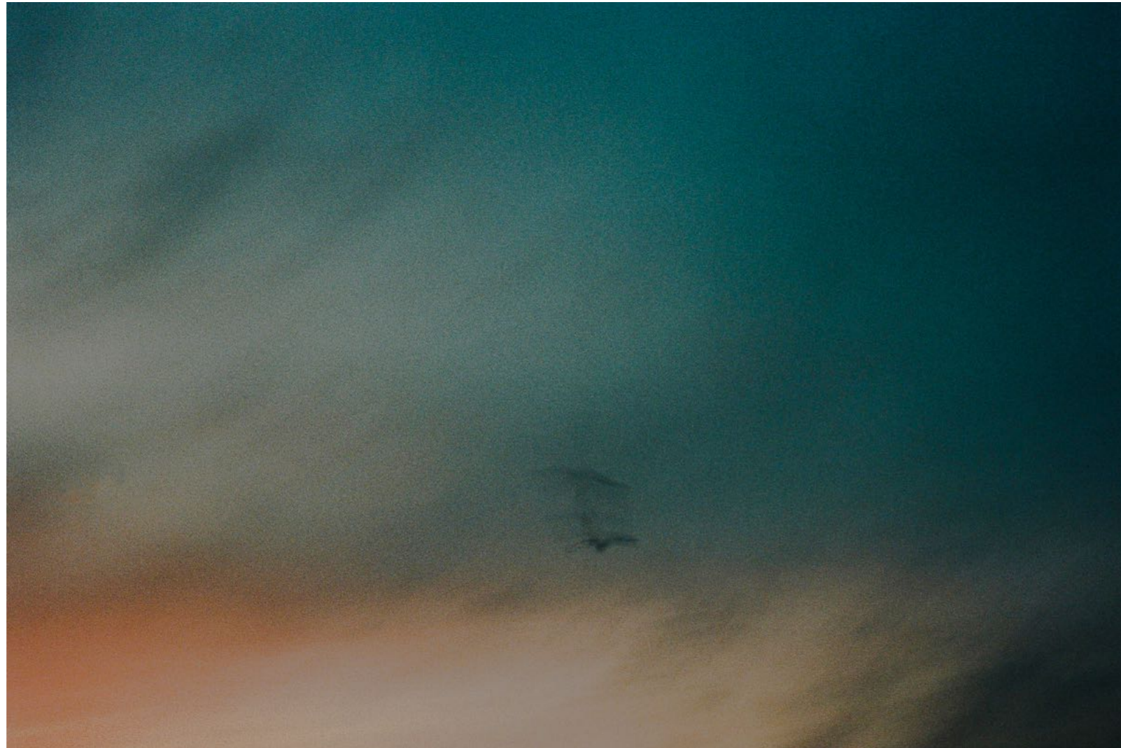
Sans titre , série Des soleils maladroits , dimensions variables, Hahnemühle Papier Photo Rag Baryta 315g, finition sur dibond. 2024. Editions de 05 tirages + 01 d'artiste.