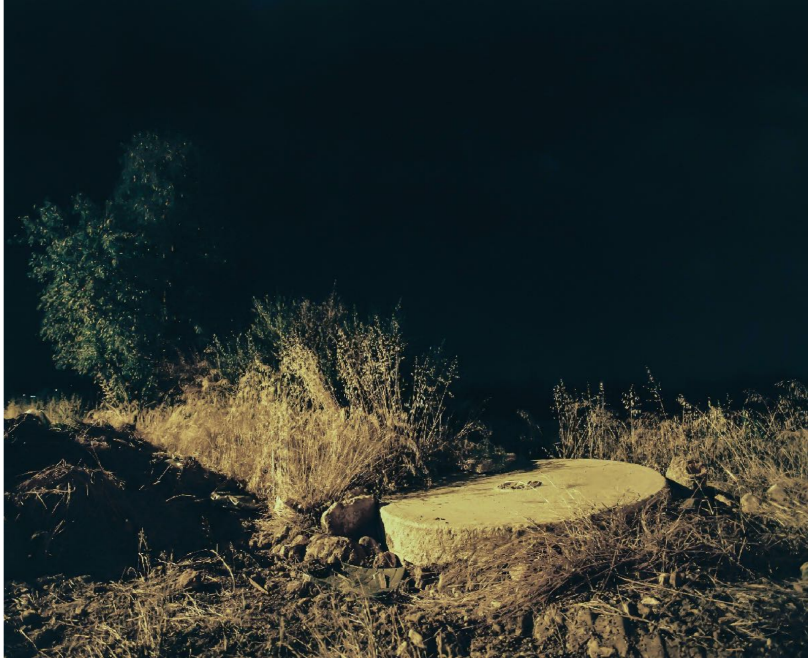
Sans titre , série D'Ombres et de pierre , dimensions variables, Hahnemühle Papier Photo Rag Baryta 315g, finition sur dibond. 2024. Editions de 05 tirages + 01 d'artiste.