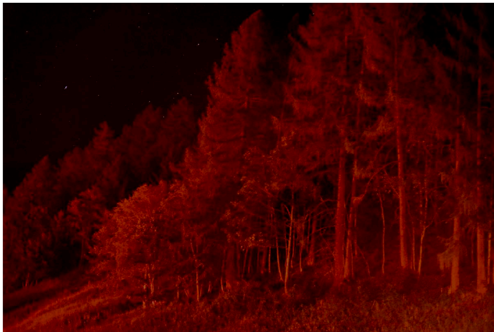
Sans titre , série Froisser la nuit , dimensions variables, Hahnemühle Papier Photo Rag Baryta 315g, finition sur dibond. 2024. Editions de 05 tirages + 01 d'artiste.