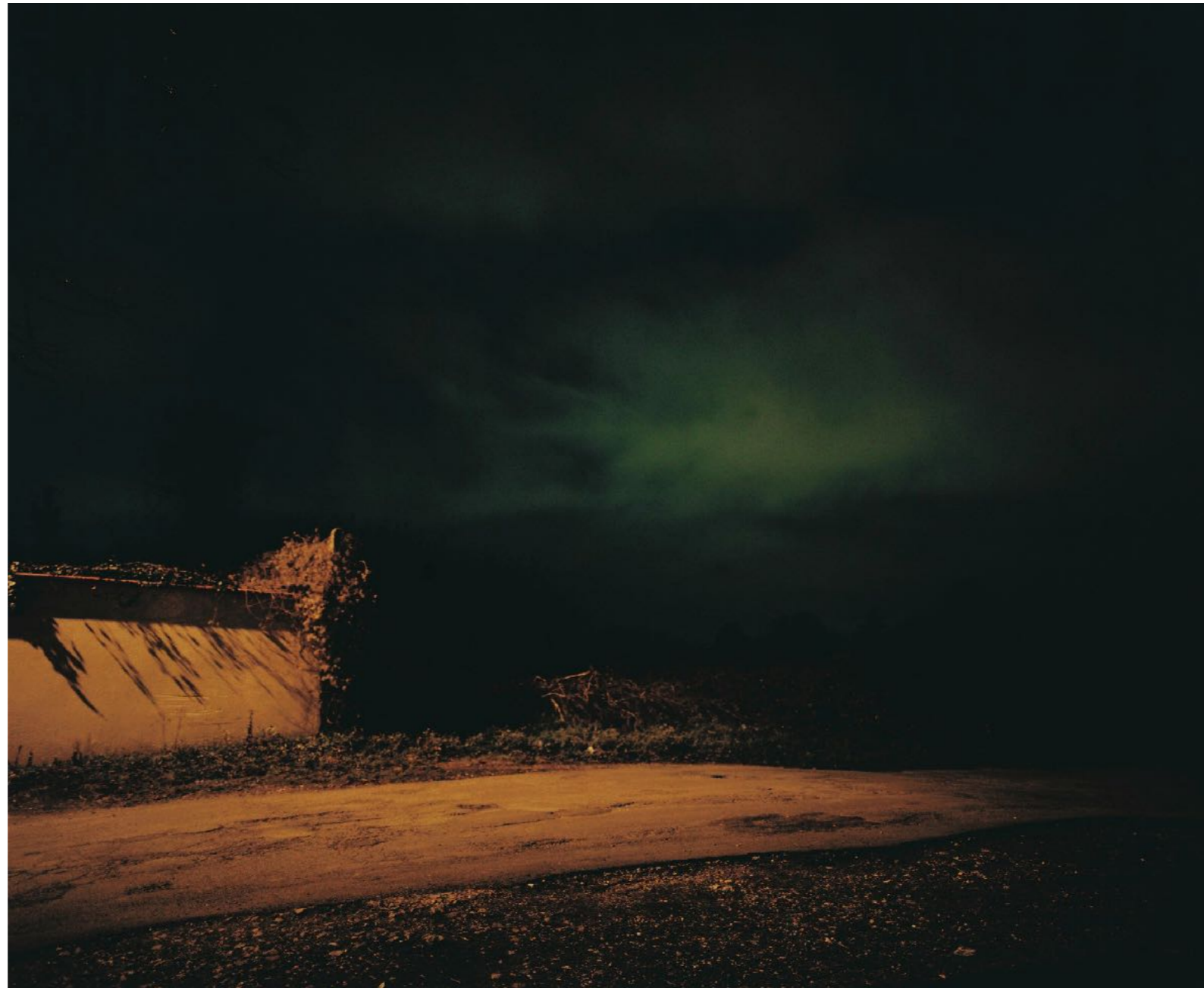
Sans titre , série D'Ombres et de pierre , dimensions variables, Hahnemühle Papier Photo Rag Baryta 315g, finition sur dibond. 2024. Editions de 05 tirages + 01 d'artiste.