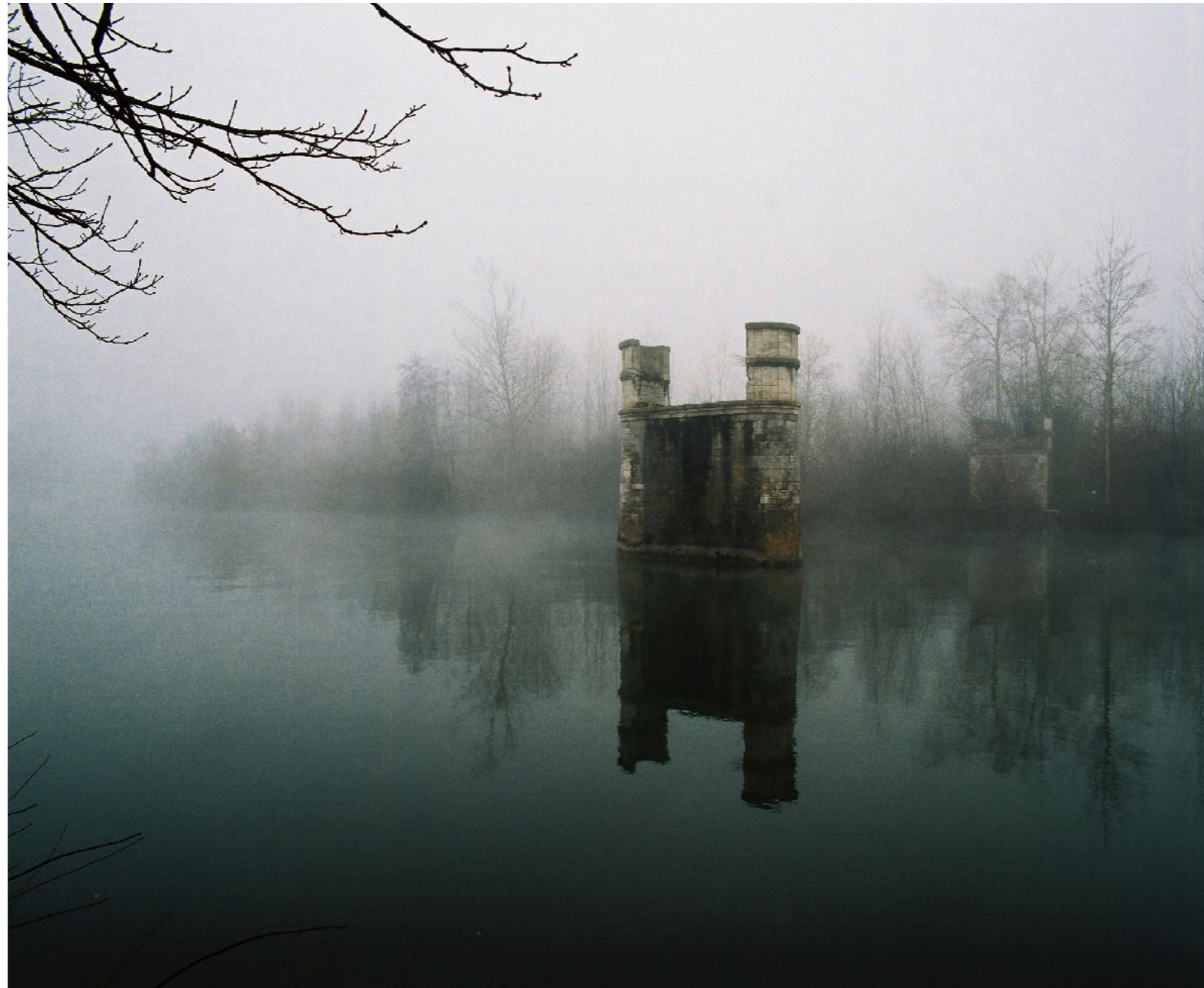
Sans titre , série D'Ombres et de pierre , dimensions variables, Hahnemühle Papier Photo Rag Baryta 315g, finition sur dibond. 2024. Editions de 05 tirages + 01 d'artiste.