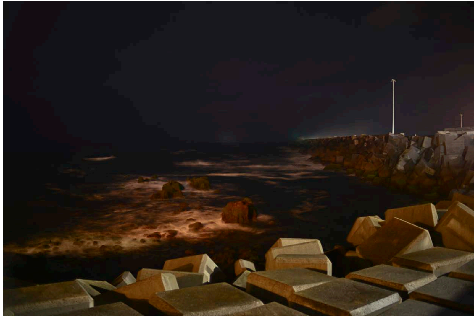
Sans titre , série Franchir les lisières , dimensions variables, Hahnemühle Papier Photo Rag Baryta 315g, finition sur dibond. 2024. Editions de 05 tirages + 01 d'artiste.