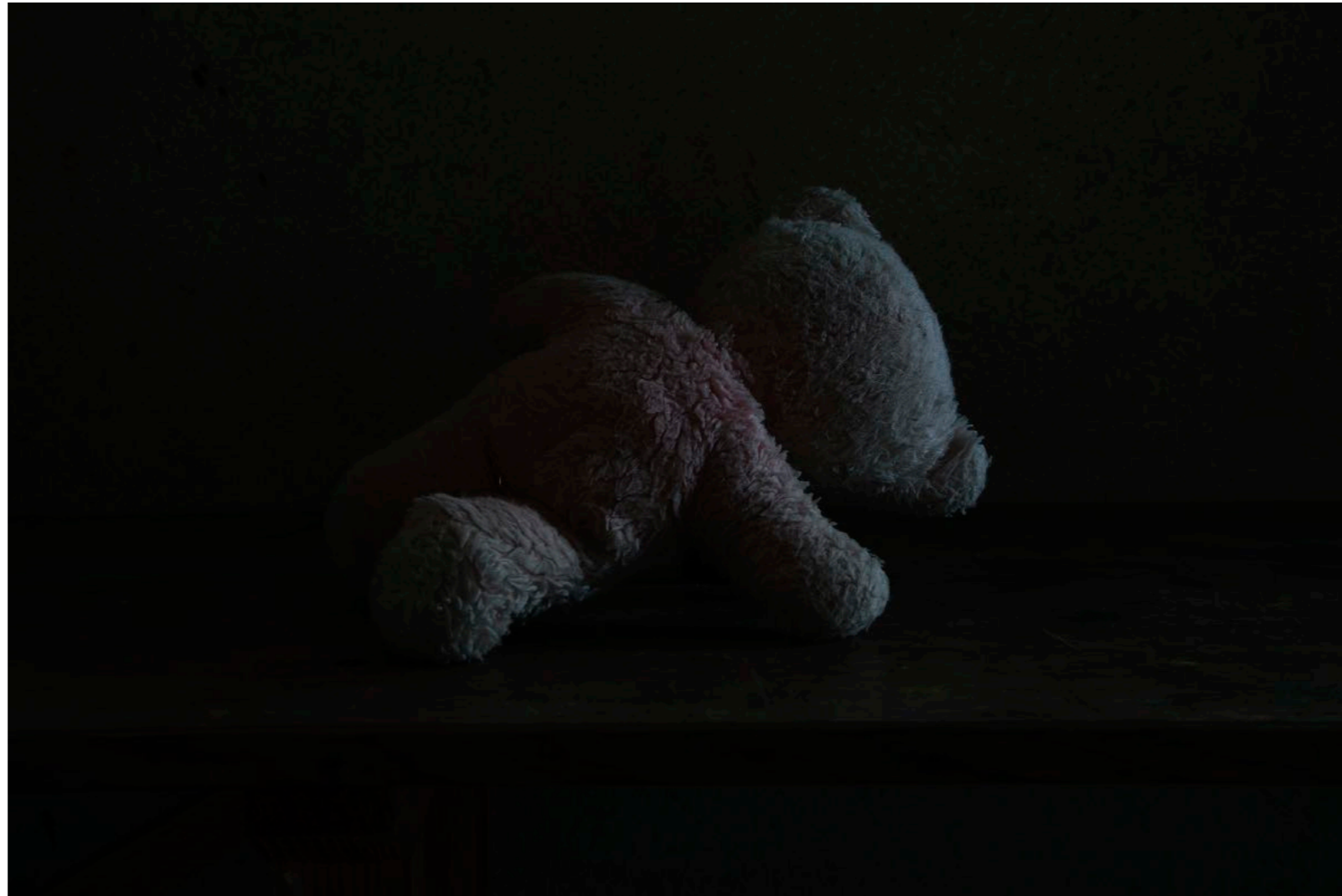
Sans titre , série Vestiges , dimensions variables, Hahnemühle Papier Photo Rag Baryta 315g, finition sur dibond. 2024. Editions de 05 tirages + 01 d'artiste.