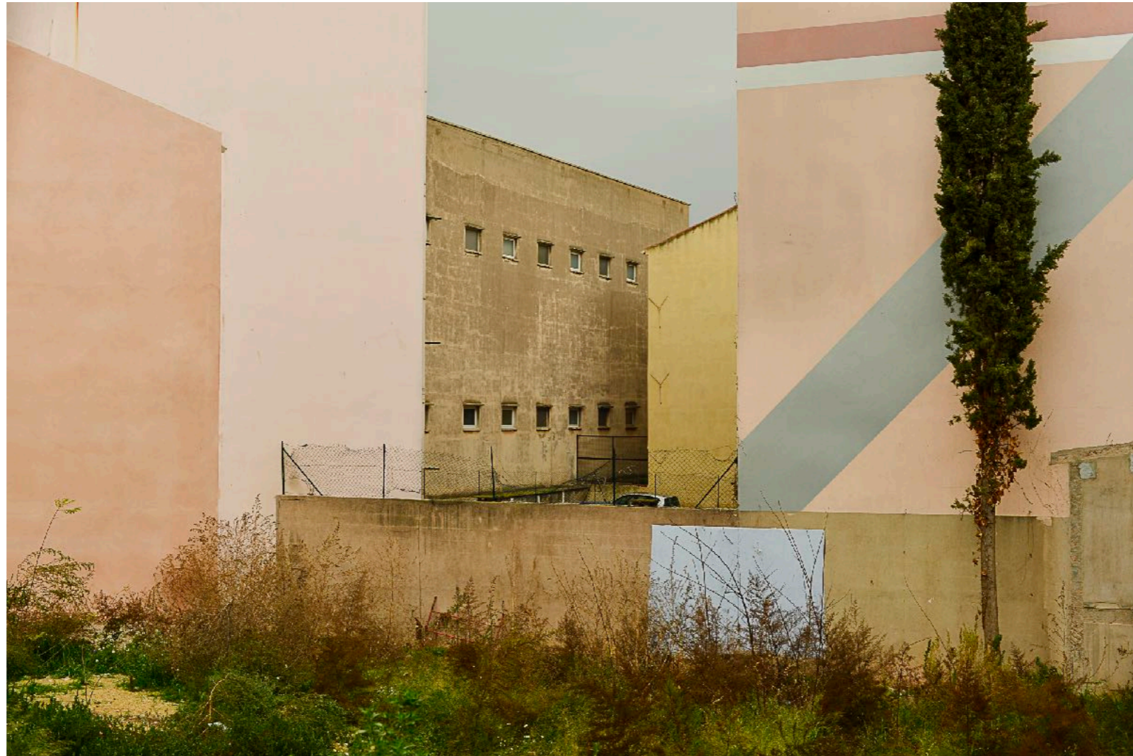
Sans titre , série Interstice(s) , dimensions variables, Hahnemühle Papier Photo Rag Baryta 315g, finition sur dibond. 2024. Editions de 05 tirages + 01 d'artiste.