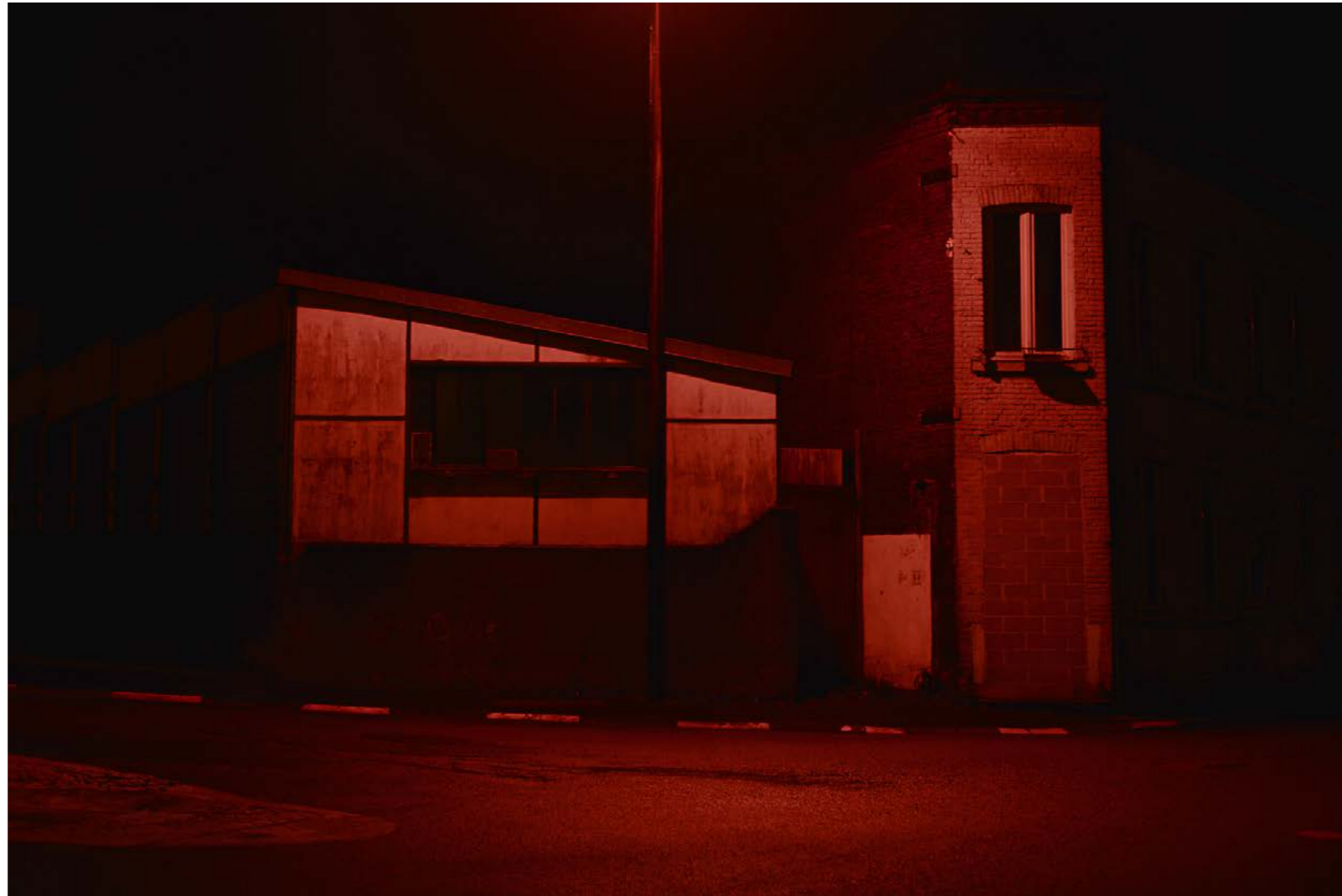
Sans titre , série Franchir les lisières , dimensions variables, Hahnemühle Papier Photo Rag Baryta 315g, finition sur dibond. 2024. Editions de 05 tirages + 01 d'artiste.