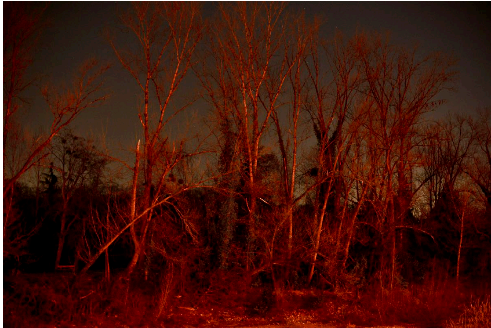
Sans titre , série Franchir les lisières , dimensions variables, Hahnemühle Papier Photo Rag Baryta 315g, finition sur dibond. 2024. Editions de 05 tirages + 01 d'artiste.