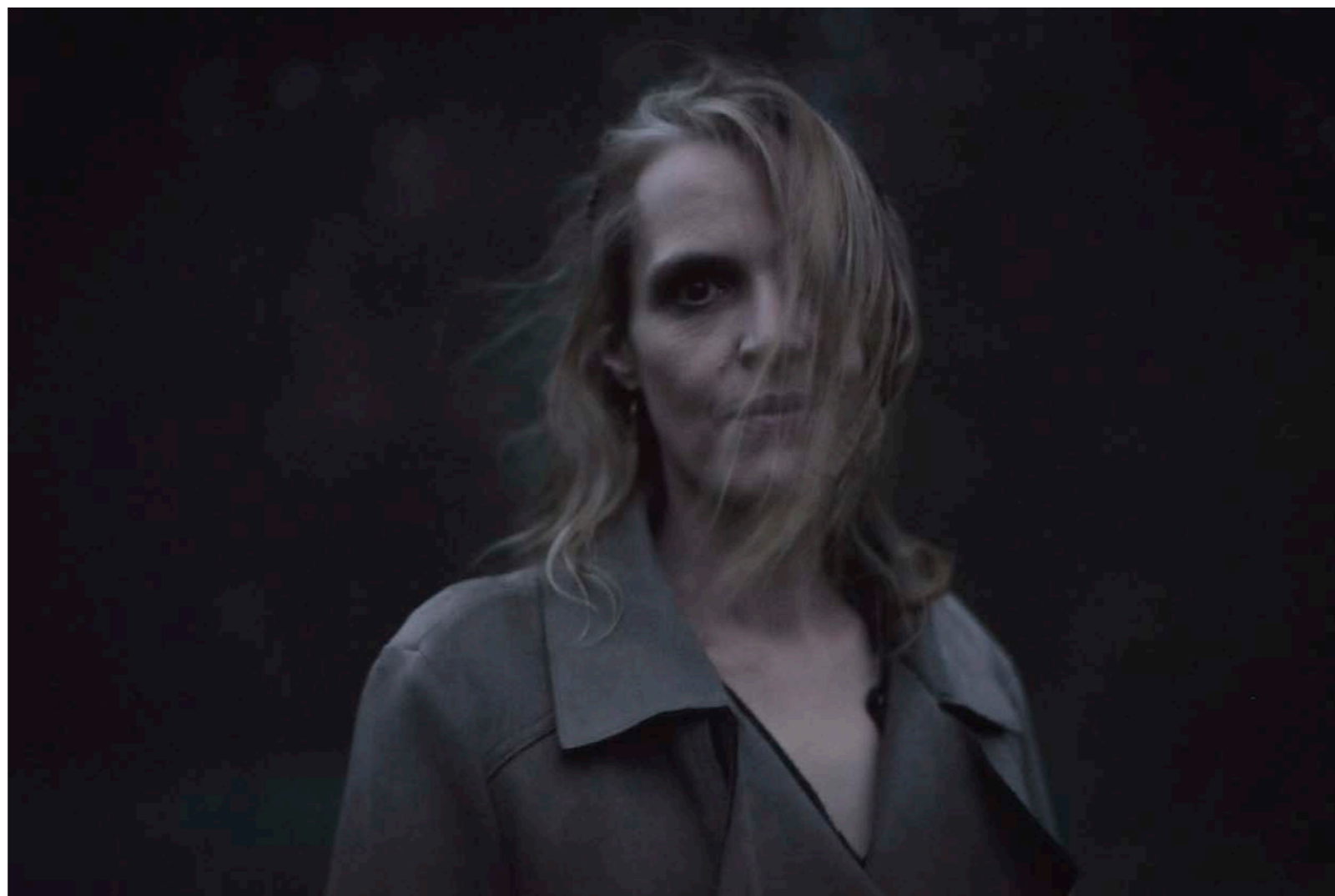
Sans titre, série D'autres matins, dimensions variables, Hahnemühle Papier Photo Rag Baryta 315g, finition sur dibond. 2024. Editions de 05 tirages + 01 d'artiste.