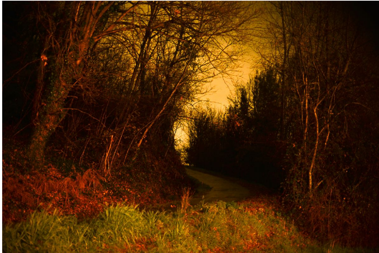
Sans titre , série Franchir les lisières , dimensions variables, Hahnemühle Papier Photo Rag Baryta 315g, finition sur dibond. 2024. Editions de 05 tirages + 01 d'artiste.