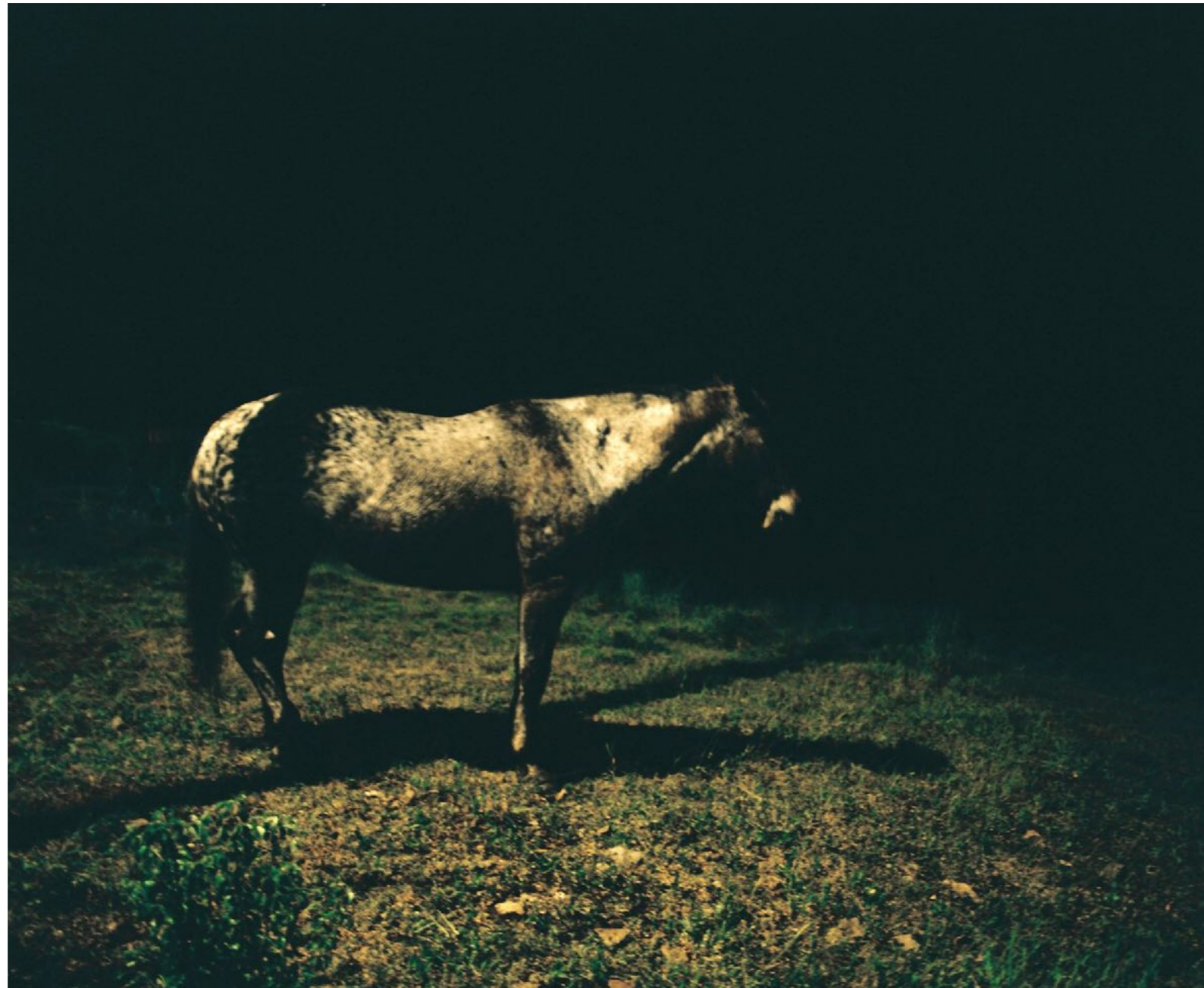
Sans titre , série D'Ombres et de pierre , dimensions variables, Hahnemühle Papier Photo Rag Baryta 315g, finition sur dibond. 2024. Editions de 05 tirages + 01 d'artiste.