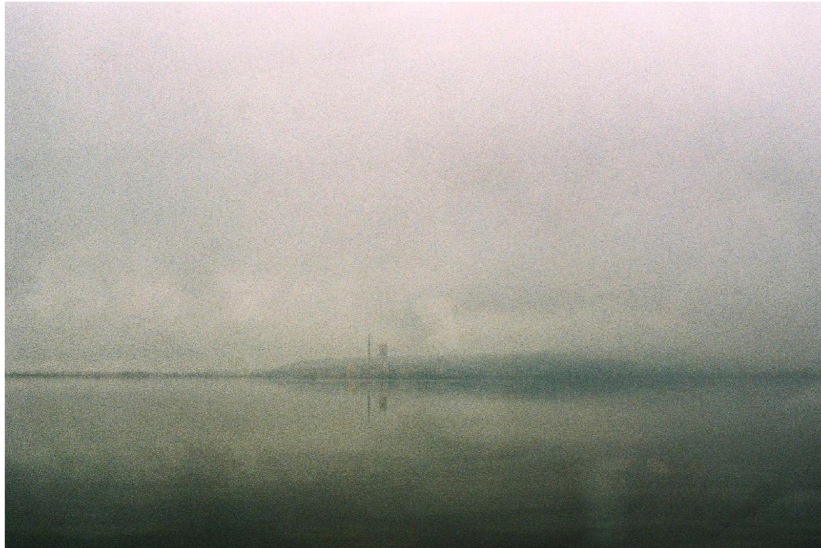
Sans titre , série Des soleils maladroits , dimensions variables, Hahnemühle Papier Photo Rag Baryta 315g, finition sur dibond. 2024. Editions de 05 tirages + 01 d'artiste.