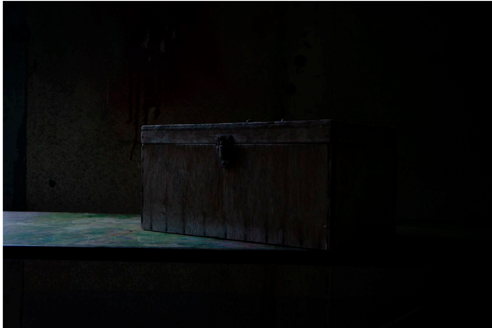
Sans titre , série Vestiges , dimensions variables, Hahnemühle Papier Photo Rag Baryta 315g, finition sur dibond. 2024. Editions de 05 tirages + 01 d'artiste.