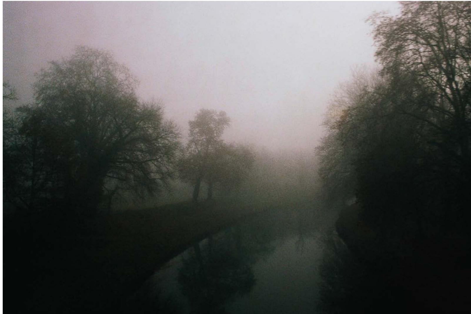
Sans titre , série Des soleils maladroits , dimensions variables, Hahnemühle Papier Photo Rag Baryta 315g, finition sur dibond. 2024. Editions de 05 tirages + 01 d'artiste.