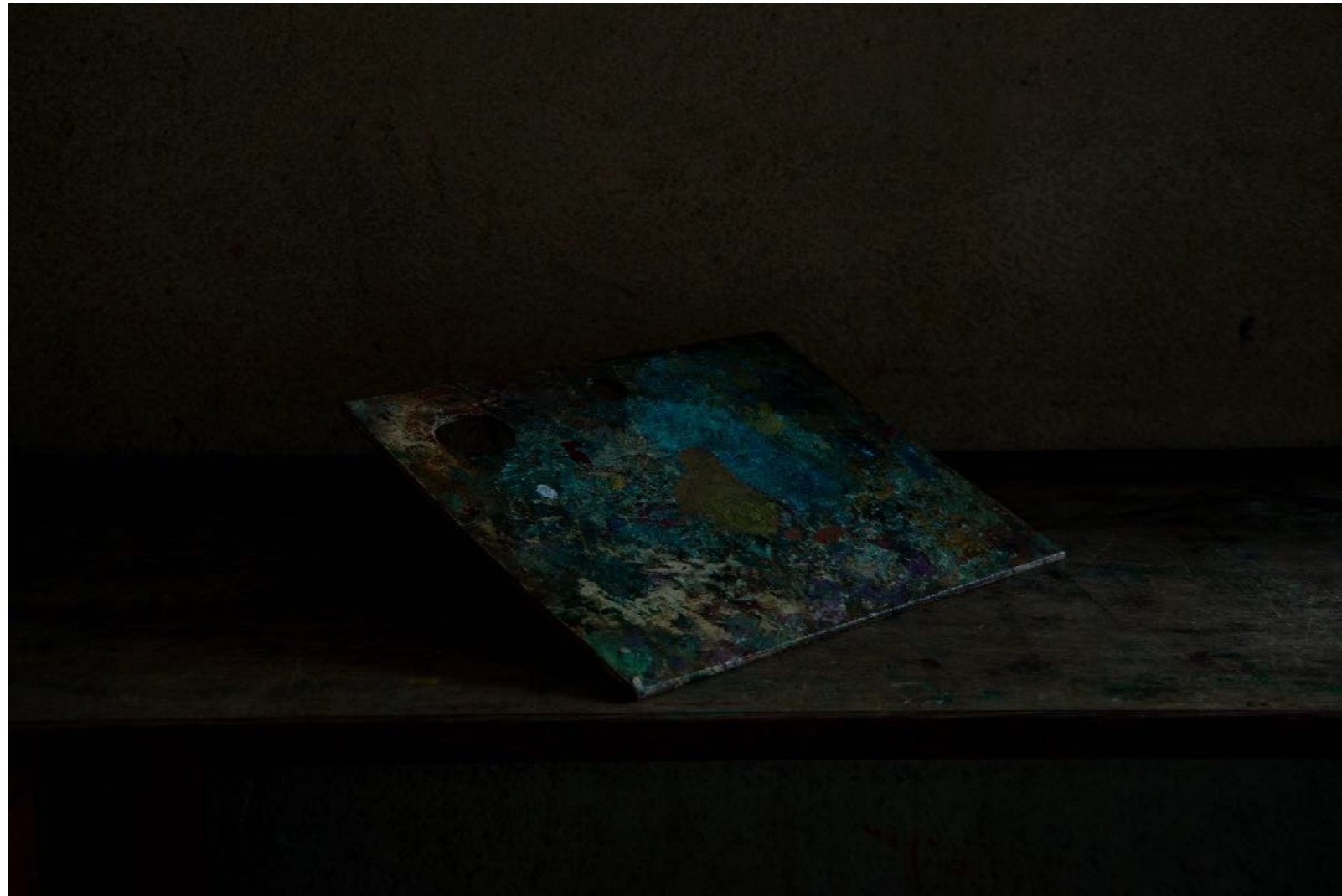
Sans titre , série Vestiges , dimensions variables, Hahnemühle Papier Photo Rag Baryta 315g, finition sur dibond. 2024. Editions de 05 tirages + 01 d'artiste.