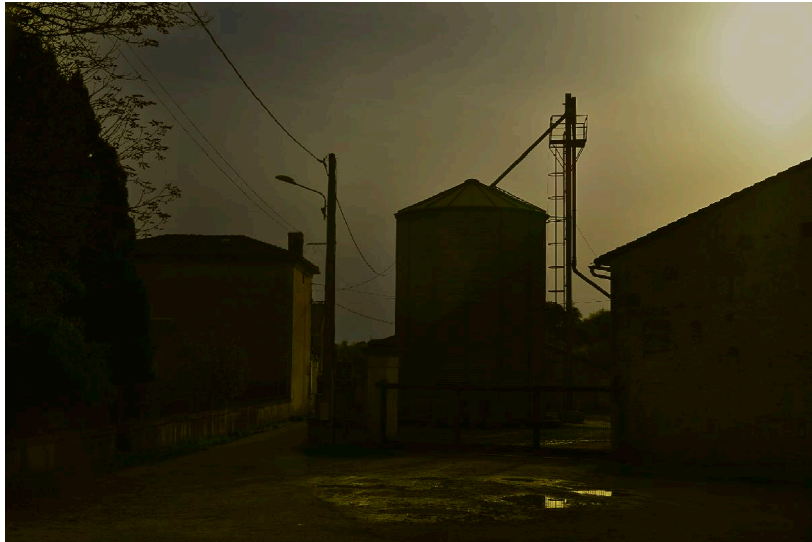
Sans titre , série Interstice(s) , dimensions variables, Hahnemühle Papier Photo Rag Baryta 315g, finition sur dibond. 2024. Editions de 05 tirages + 01 d'artiste.