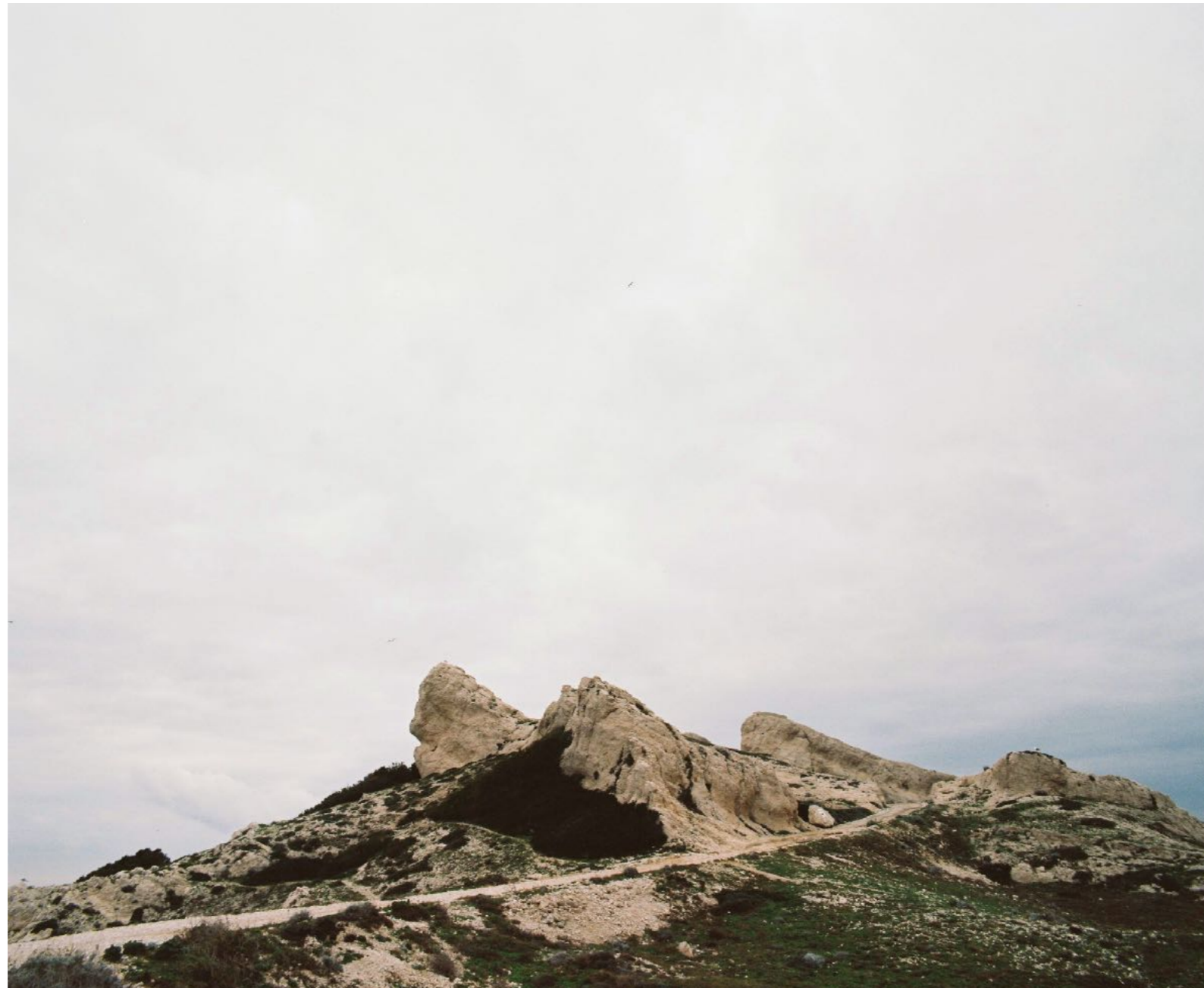
Sans titre , série D'Ombres et de pierre , dimensions variables, Hahnemühle Papier Photo Rag Baryta 315g, finition sur dibond. 2024. Editions de 05 tirages + 01 d'artiste.