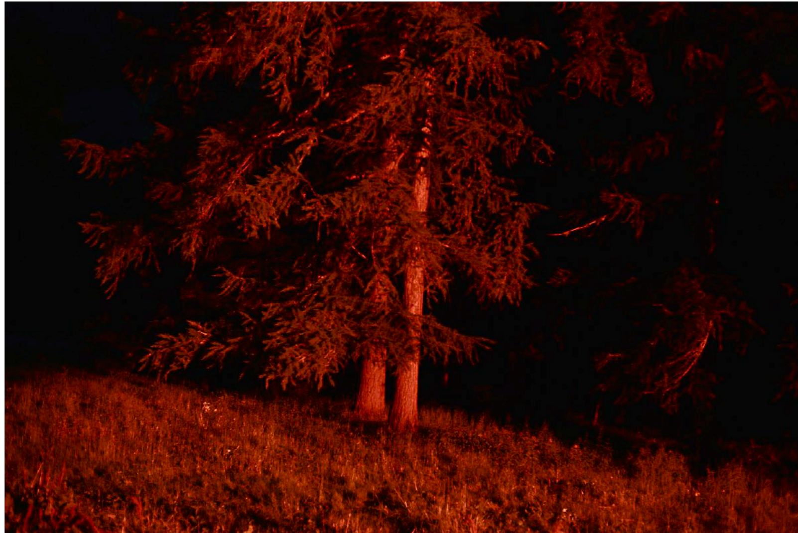
Sans titre , série Froisser la nuit , dimensions variables, Hahnemühle Papier Photo Rag Baryta 315g, finition sur dibond. 2024. Editions de 05 tirages + 01 d'artiste.